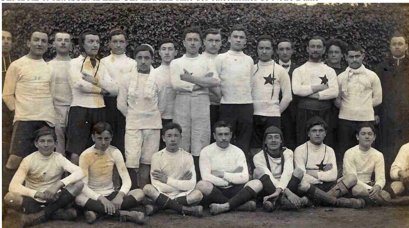
Une équipe de football en 1910

9 DECEMBRE 1912:ASSEMBLEE GENERALE salle des catéchismes de Notre Dame